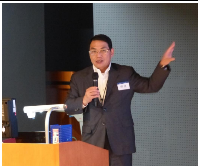
明道理事長レクチャー