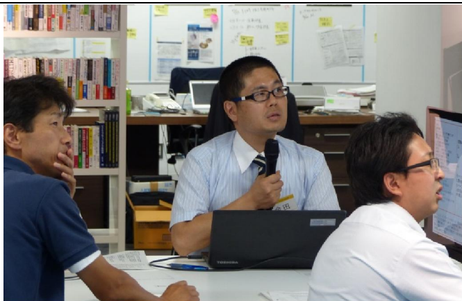
ワークショップ チーム発表