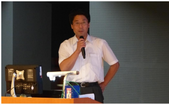
株式会社アイ・タックル松田氏ご講演