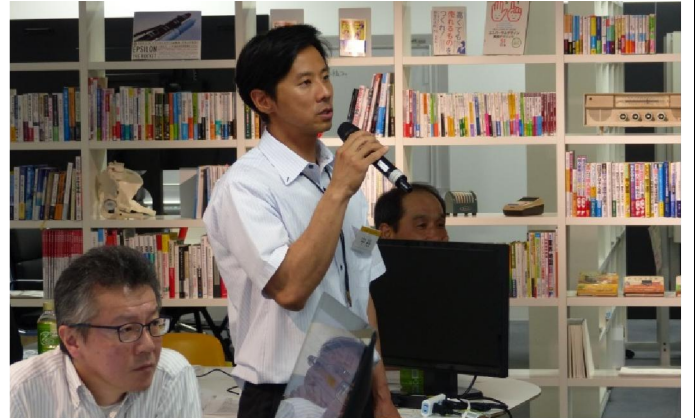
ワークショップ チーム発表