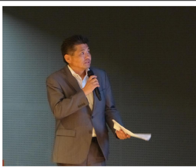
株式会社アイ・タックル水沢社長ご講演