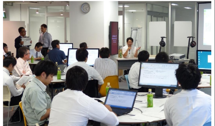
ワークショップ 全景