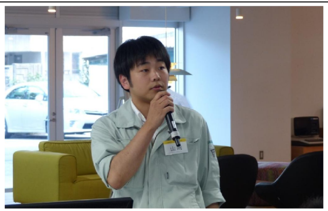
ワークショップ チーム発表