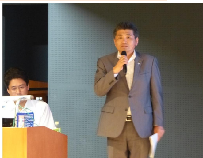
株式会社アイ・タックル水沢社長ご講演