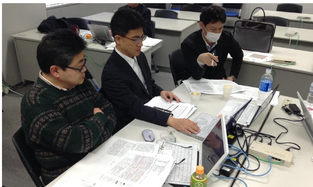
グループディスカッションの様子②