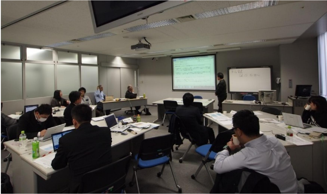
チーム発表の様子