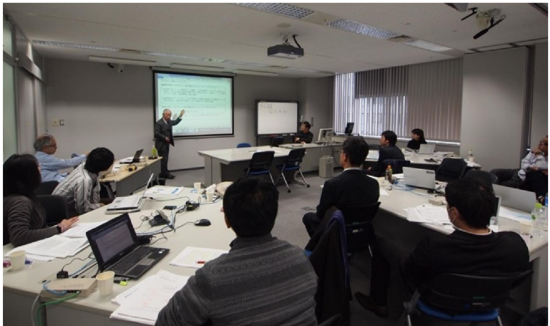
世森判定委員長による講評の様子